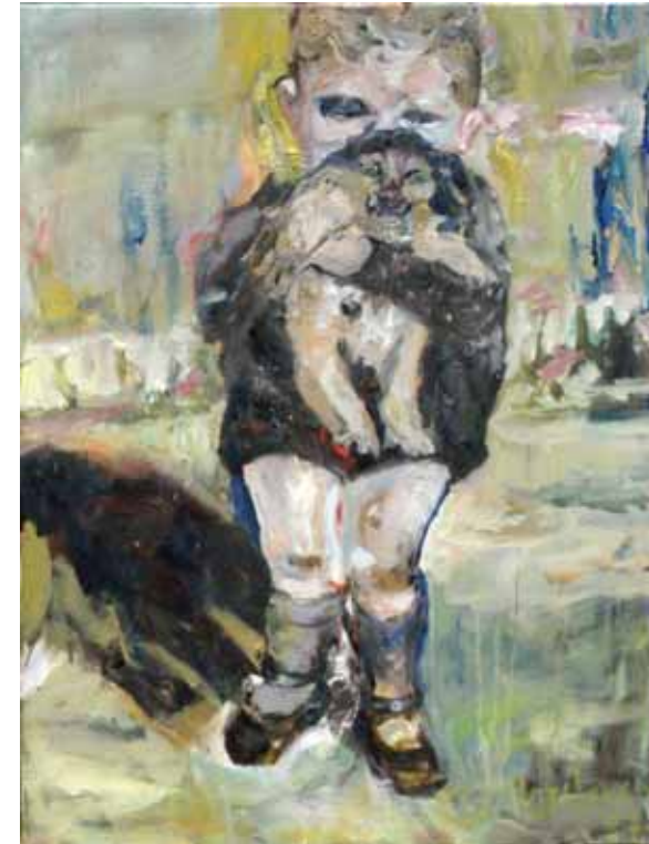
« Frère »