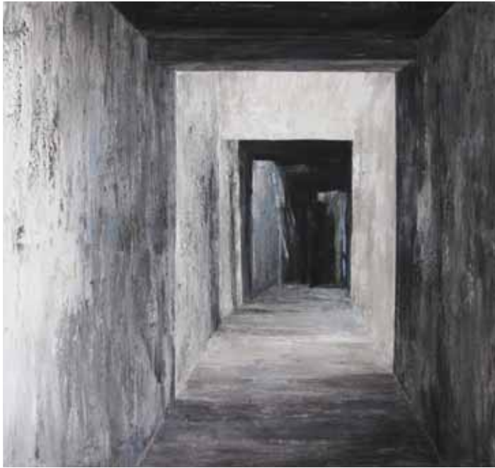
« Evasion »

Enduit et acrylique sur toile - 100 x 100 cm