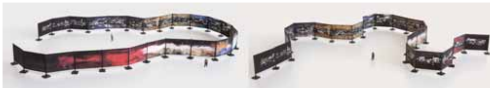
Fragment des « 24 Caprices »