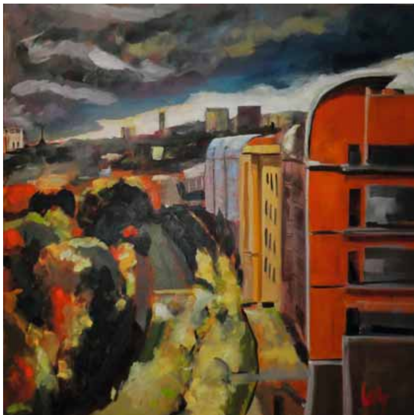
« La cité »