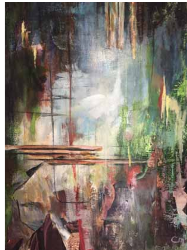
« Le petit Sterne »

M a peinture avec sa palette flamande est un clin d'œil à mes origines, avec mes touches franches et colorées, un jeu constant entre ombre et lumière, représentant ici la cité européenne, point d'entrée de Lyon dans le futur.