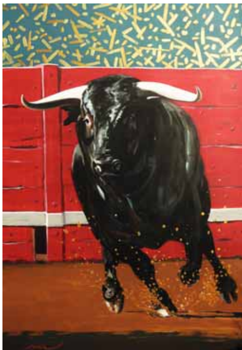
« Toro »