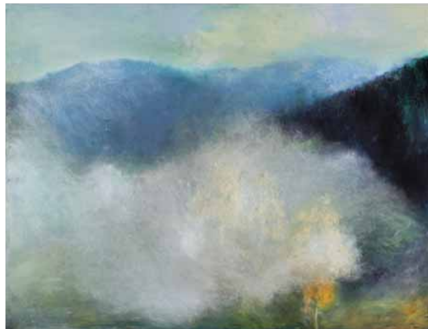
« L’arbre perdu »