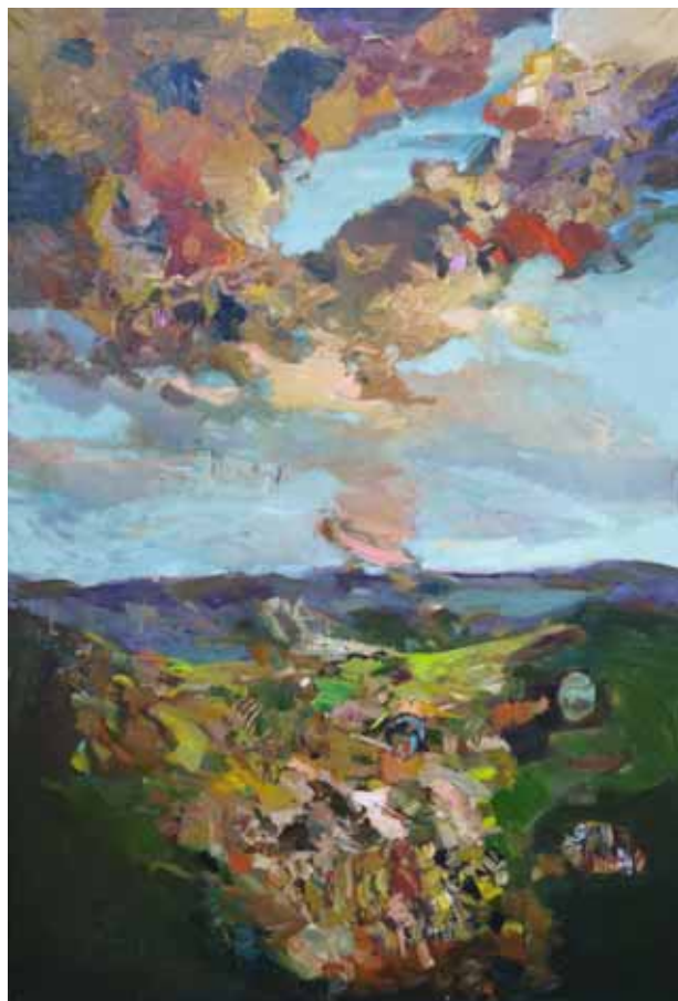
« L'insaisissable »