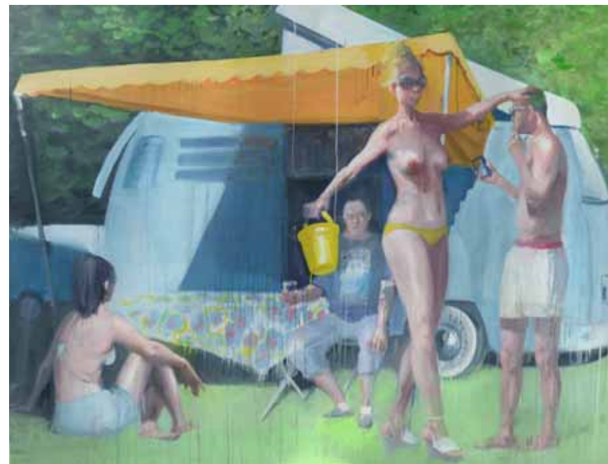
« Camping »

Des forces graphiques opposées s'y côtoient, la toile est coupée en deux, par une diagonale instable qui induit un malaise, une succession de triangles et lignes de forces mais j'ai essayé de faire tenir en équilibre harmonieux l'ensemble de ces paramètres... La couleur presque saturée des roses, des rouges et ocres s'opposent au monde gris de la partie supérieure qui nous montre des êtres de passage qui subissent... D'ailleurs, aucun corps n'a de repère précis dans l'espace, les enfants flottent, la jeune femme est coupée en deux, personne ne fait attention à l'autre, tout est suspendu dans un espace temps indéterminé mais si l'on regarde attentivement la composition, l'on s'aperçoit que le grand triangle formé par l'homme de dos, et les enfants en haut se ferme sur la main de la jeune femme en rose, assise, à l'endroit de son sexe. La vie est ainsi la plus forte.