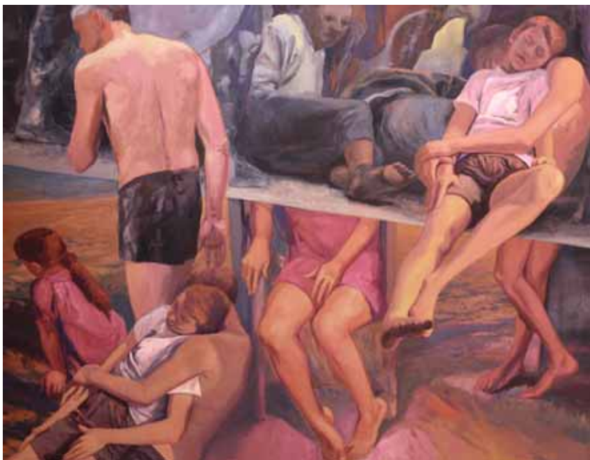
« Rencontre N°5 »

Pigment caparol sur toile - 180 x 140 cm