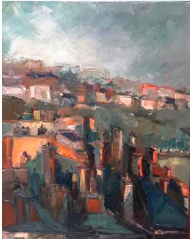
« Croix-Rousse »