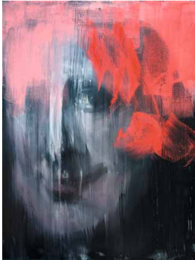
« Repenti »