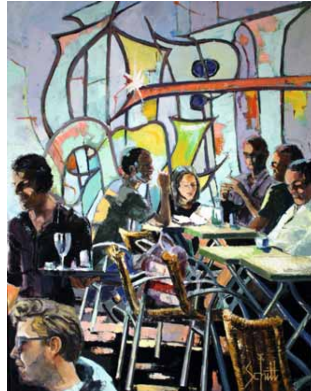
« Interieur café IV »

L a lumière sur les toits est source d'abstraction et de vibrations, elle rend chaque fois le thème nouveau et m'entraîne vers la simplification afin de laisser passer sa magie.