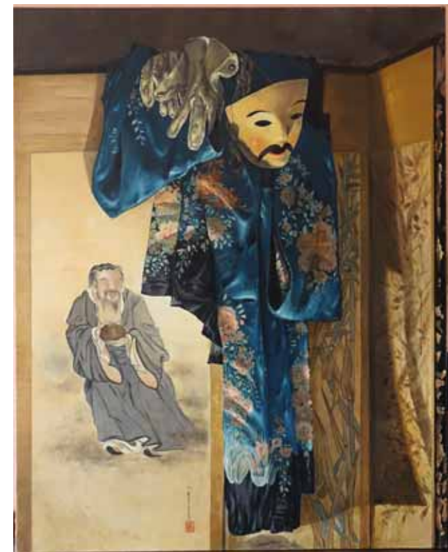
« Masque et Kimono »

J'espère que ma démarche artistique débouchera sous une forme sonnante et trébuchante.