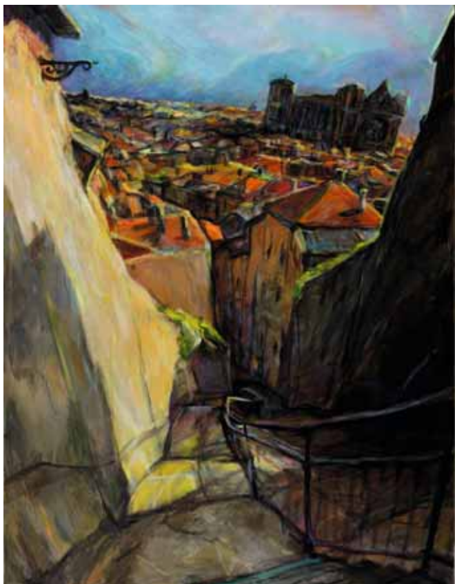
« Paysage de Lyon »