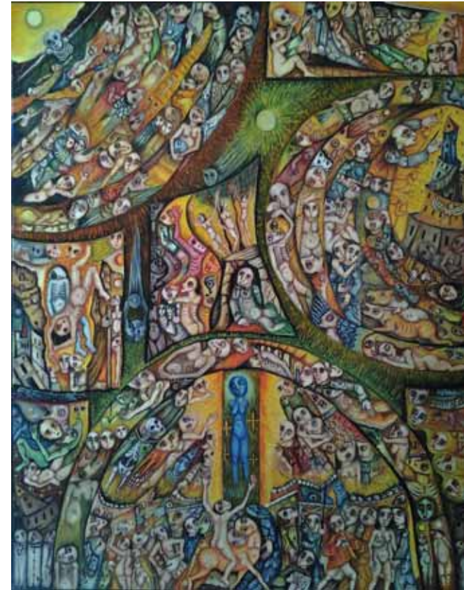
« Mort-Créateur-Adorateur... »