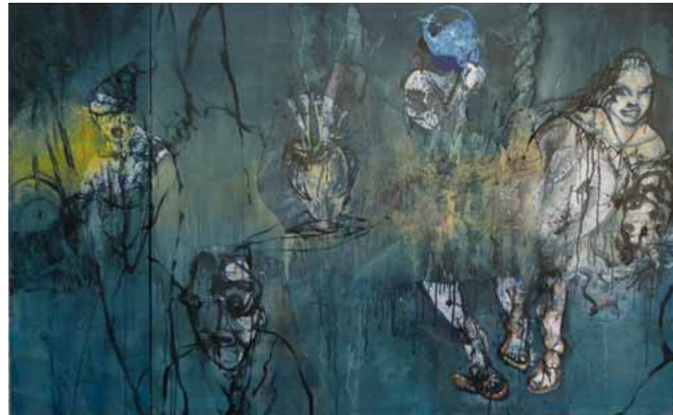
« Blue sun Flo »

Soit par curiosité, vous empruntez cet escalier vers des mondes nouveaux dans l'espace ou dans votre après, il y a de l'espoir.