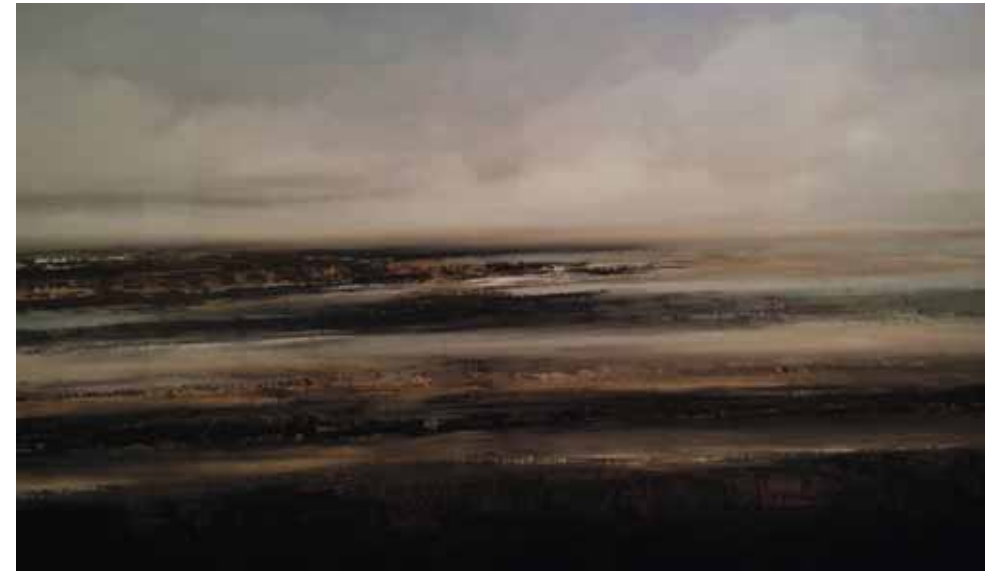
« Pays lointain »