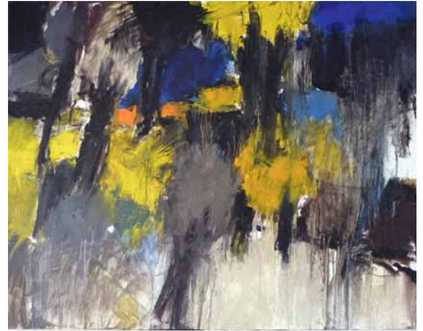
« Jaune et Noir »

Ce tableau est une proposition faite à chacun d'atteindre son intériorité, de questionner sa place dans l'espace et le temps pour mieux comprendre le sens de sa vie.