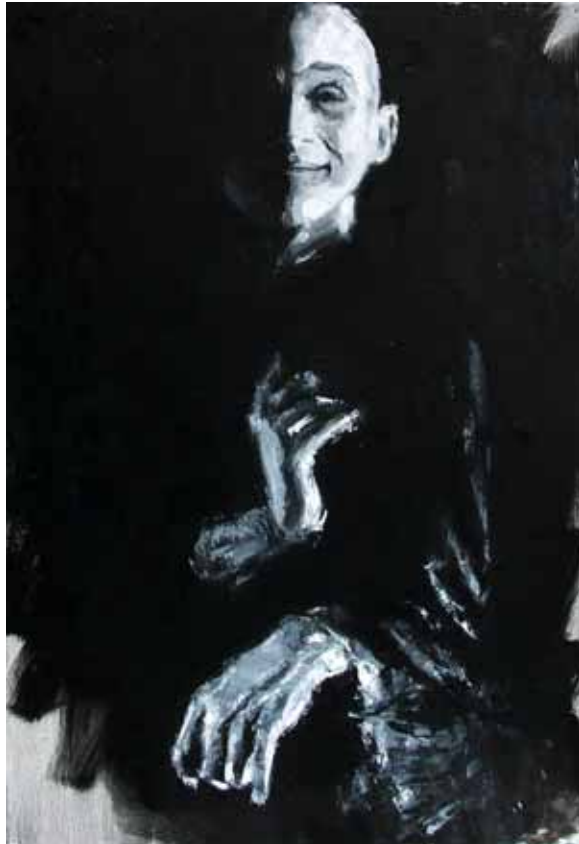
« Butô »