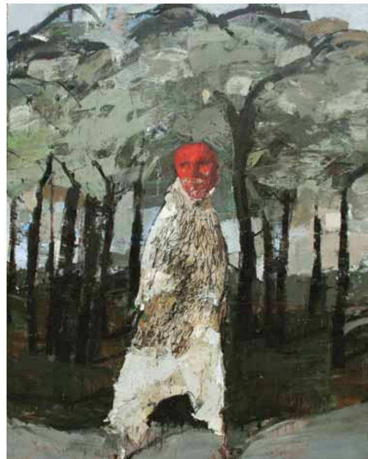
« Chaman »

L e plomb et l'or ne comptent pas. Les nuages sont les instruments de la joie.