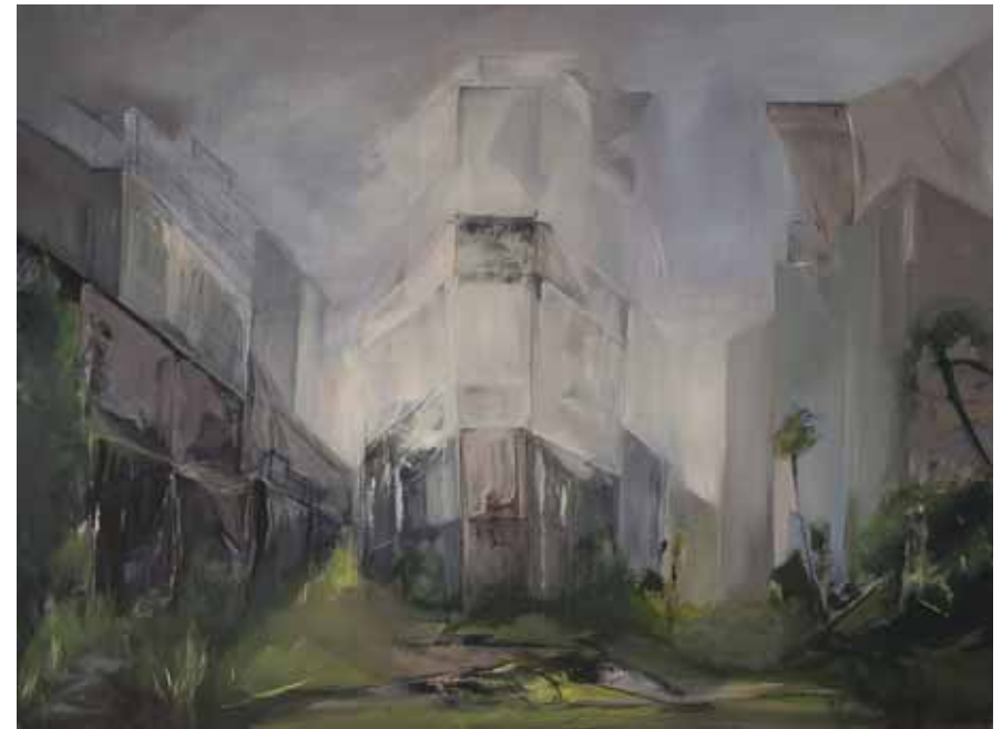
« Renaissance »