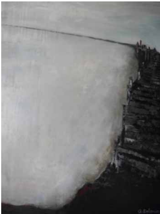
« Passage vers l'infini »