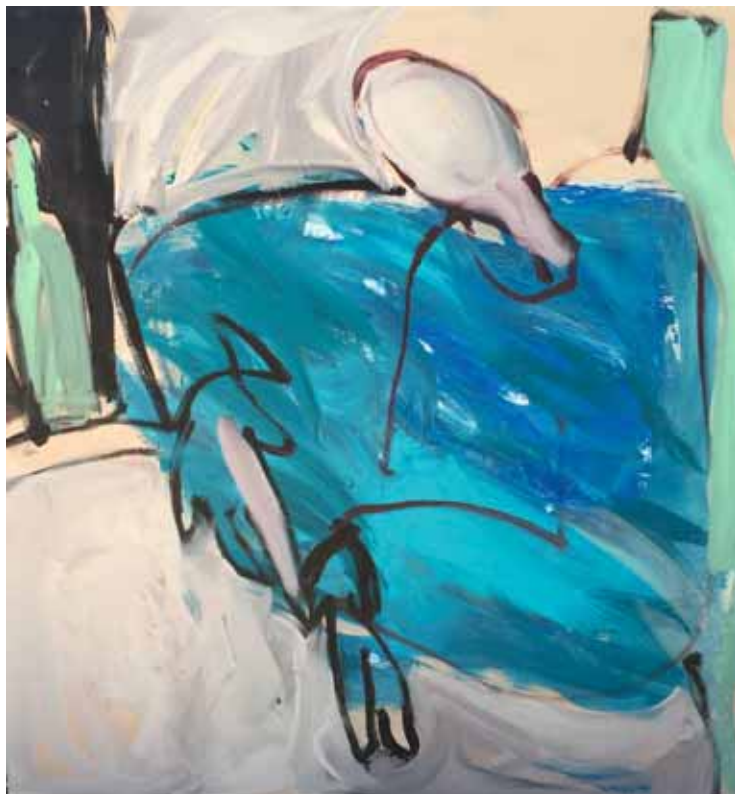
« Le Monsieur »