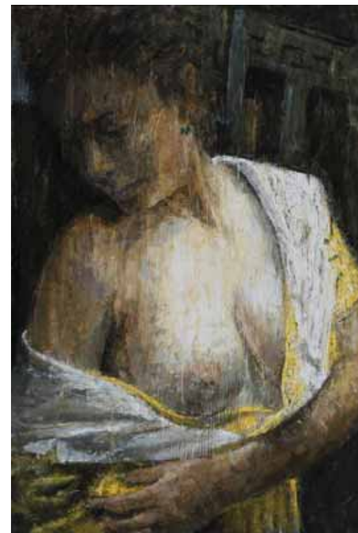
« Sensuelle »

Ainsi je longe les murs et je chemine tel un pèlerin."