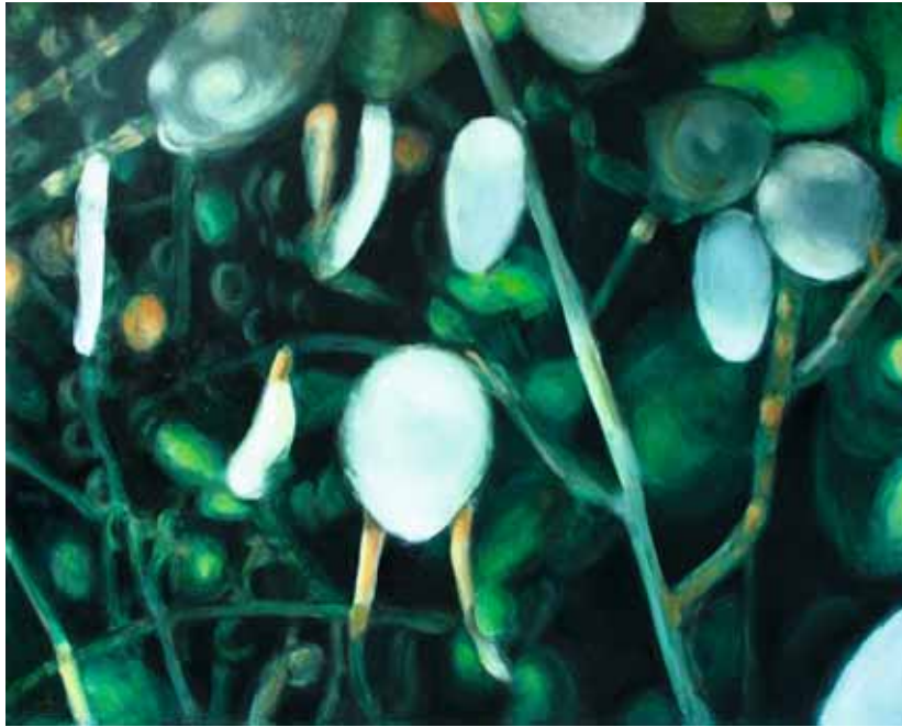
« Les Lucioles »