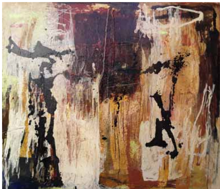
« Sans titre » ; série « Murs sauvages »

Technique mixte : acrylique, encre, collage et pigments sur bois - 181 x 153 cm